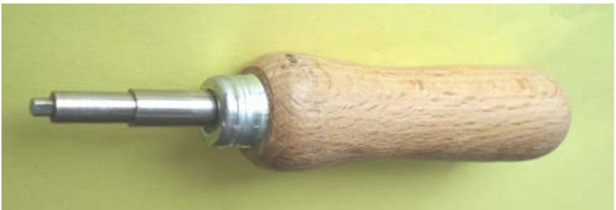
Vierkant zum ausrichten der Degenkontakte