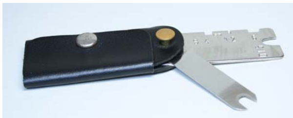
Prüflehre für Degen und Säbel